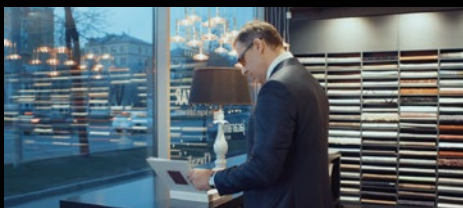
Презентационные и имиджевые видео