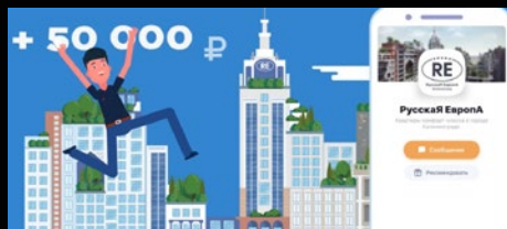
Инфографика и анимационные видео